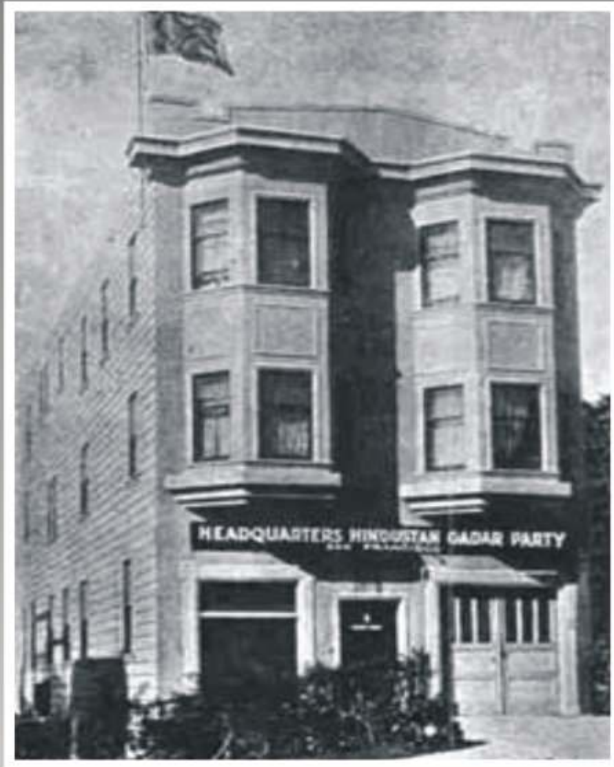
ਸੈਨ ਫਰਾਂਸਿਸਕੋ, ਅਮਰੀਕਾ ਵਿਖੇ ਗਦਰ ਪਾਰਟੀ ਦਾ ਹੈਡਕੁਆਟਰ (ਯੁਗਾਂਤਰ ਆਸ਼ਰਮ)